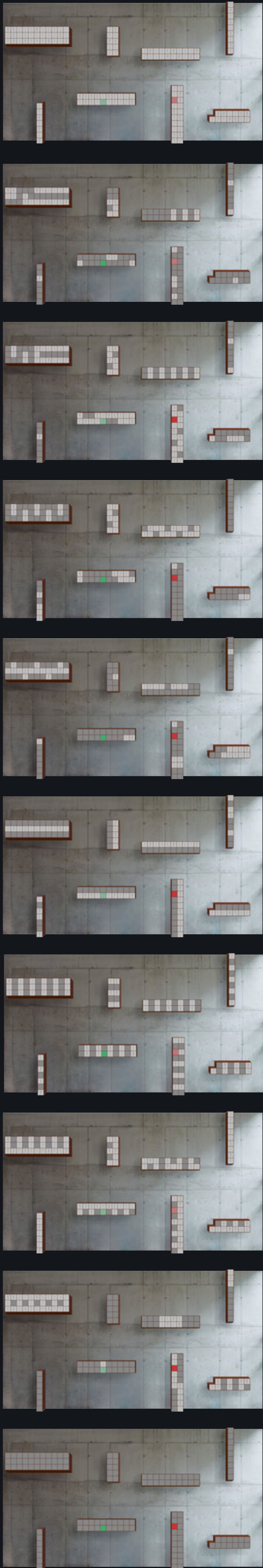
Beispiele für Schaltmustersequenzen